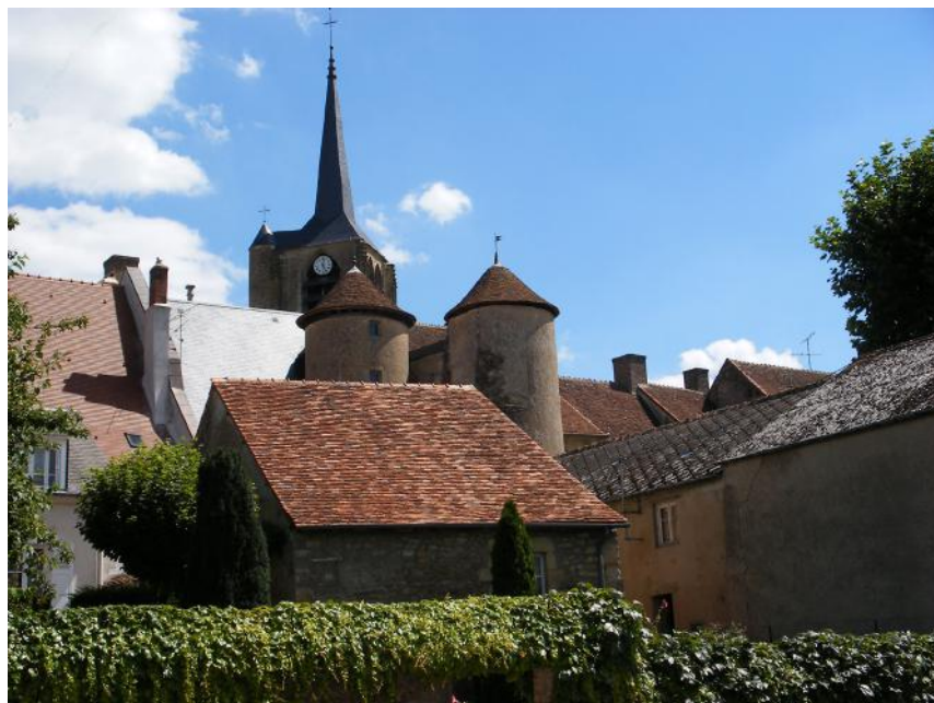
Bourg de Moulins-Engilbert