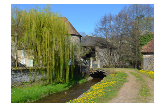
Tour du Guichet